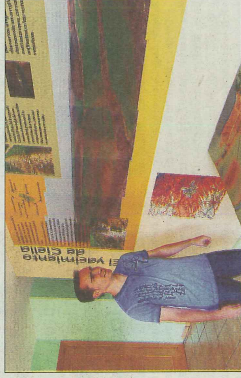
Algunos de los elementos del yacimiento se encuentran en el aula arqueológica.