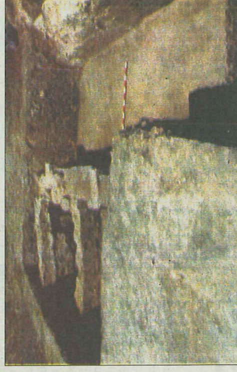
Muestra de las excavaciones de 1989. Actualmente están enterradas.

gonistas de las pinturas, en las que muestran controvertidas posturas. «Además todo parece estar en silencio a pesar de que se recreen martirizaciones. No hay ruido, eso es el Renacimiento. Está todo atemperado, no hay sentimiento».